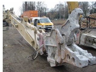
Links: Maximilian-Center; Mitte und rechts: Abbrucharbeiten DLW

Weitere Planungsleistungen des Ingenieurbüro Miltner werden u.a. gleichzeitig erbracht: