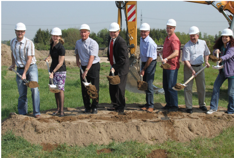
Spatenstich am 21.04.2011